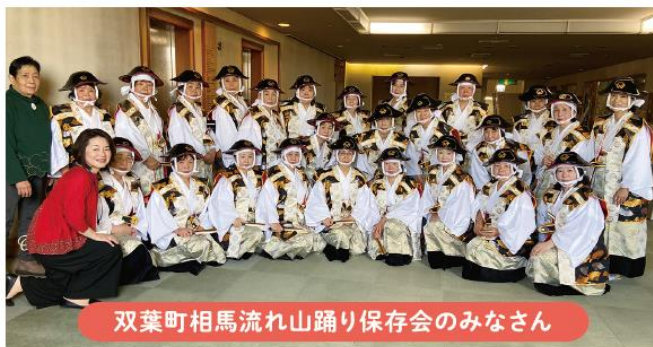
双葉町相馬流れ山踊り保存会のみなさん

さらに、客席を輪で囲んで「ふたば音頭」を踊り、会場を盛り上げました。来場者は「踊っている姿を見て元気がでます」「自分も踊っていた頃を思い出しました」と、ふるさとへの想いを寄せていました。