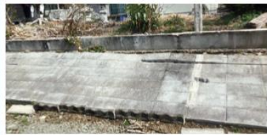
ブロック塀の被害も随所に見られました