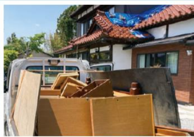
被害にあった家の中のものの撤去作業