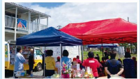
3月から活動した拠点を移転し、6月にみなみ そうま市民とNPOによる災害支援チーム「こ のゆびとまね」のサロンスペースが開所