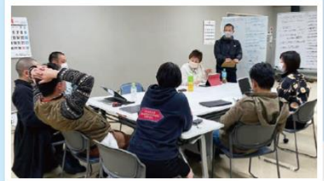
被害に対してできることを模索