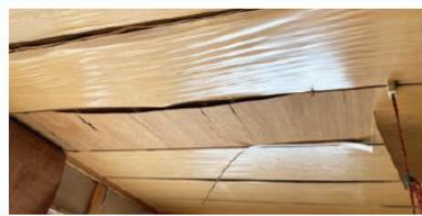
屋根被害によって雨漏りも発生