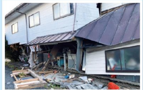
納屋の1階部分が潰れてしまっている