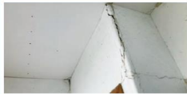
外からは分からない壁の亀裂の被害も多い