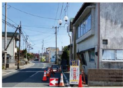
車道へと傾いた住宅

※ふうあいねっと広報の天井が茨城と南相馬市の二拠点生活をしているため鹿島区のNPOの支援活動に参加しています。