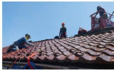
これまでの災害対応の中で経験を積んで きた方々によるブルーシート張りや瓦の ズレ直し