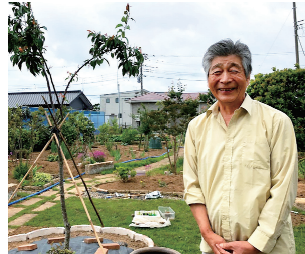
鹿嶋市のご自宅のお庭にて