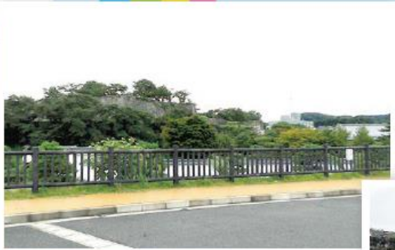
↑白河市 国指定史跡 小峰城跡