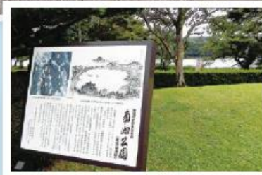
↑白河市南湖公園 1801年 松平定信が築造した 日本最古といわれる公園