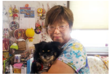
愛犬ライムと一緒に

会津の仮設住宅に4年住んで、これからはいわきに住もうと、あちこち見て回ったけど、とにかく土地が高い!こんな高い土地を買ったら家は建てられない。雨降ったら傘さしてブルーシートの生活になっちゃうよってハウジングさんに言ったら、いわきに近いし茨城だったらどうですか?って勧められて決めました。もと畑だった土地だから、野菜作りや花壇をするのにはとっても土が良く、スイカもできました。ご近所さんと野菜の交換をするんだけど、一人分でいいよって言っても、たくさん置いていってくれる。みんなが声かけあって楽しいですね。