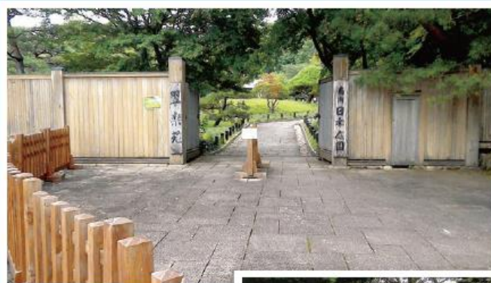
↑翠楽園 南湖公園の一角にある 回遊式日本庭園