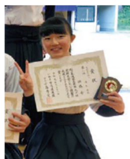
高校では弓道部の副部長として、みんなをまとめる経験をしました。

将来は、医療系に進みたいと思っています。放射能という目に見えないものの怖さを経験しているので、新型コロナウイルスのことも正しい情報を伝えていきたいと思い、本やニュースを見て勉強しています。