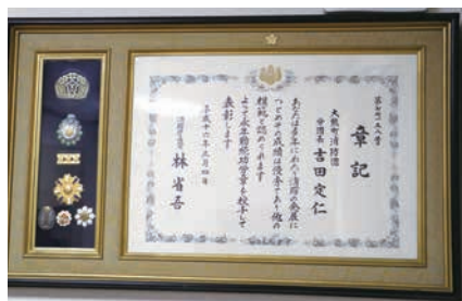
ご主人がいただいた消防庁長官章

私は息子の所に居て、その間に友達からの連絡で、都庁で被災者向けの住宅を申し込みましたが見事に落選。その後、都から連絡が来て4月に6畳と4畳半のある部屋の鍵を貰い、次の住まいを探しながら4年9ヶ月居ました。その間自分で出来ることを考えて、私は音楽をしていたので音楽があると思って活動センターのピアノを借りて練習していたら、敬老の集いで歌って下さいって頼まれて歌ったんです。そしたら、次も頼まれて1時間弱のコンサートを4、5回やりました。中学校のPTA向けに体育館で歌ったり、区会の方にも頼まれたりという活動をしました。