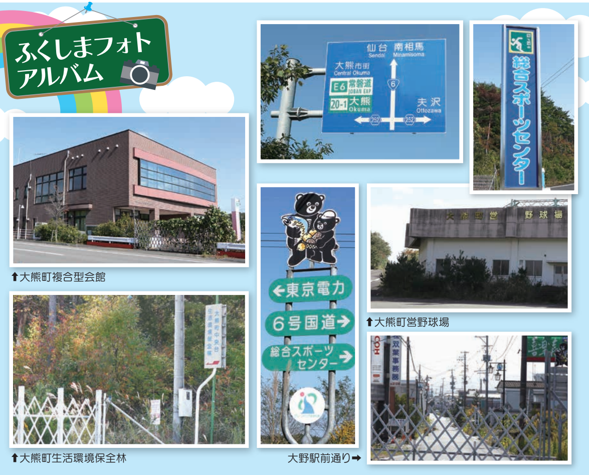
↑大熊町複合型会館