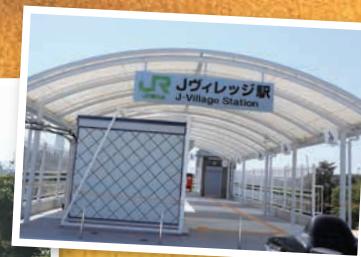
↑広野町Jヴィレッジ駅

今年の干支は、子ですが…今回はハリネズミを描きました。丸くなって寝ている隣には、福島県のリンゴです。毎年親戚が送ってくれて、いつも美味しく頂いています!福島県は果物もおいしいですね😊