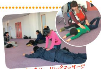
きょうりももみ、リンパマッサージ