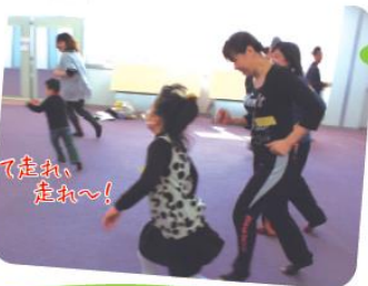
曲に合わせて走れ、走れ～!