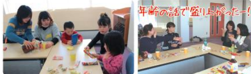
年齢の話で盛り上がったー!