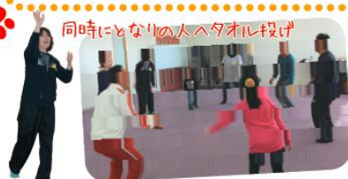
同時にとなりの人へタオレ投げ