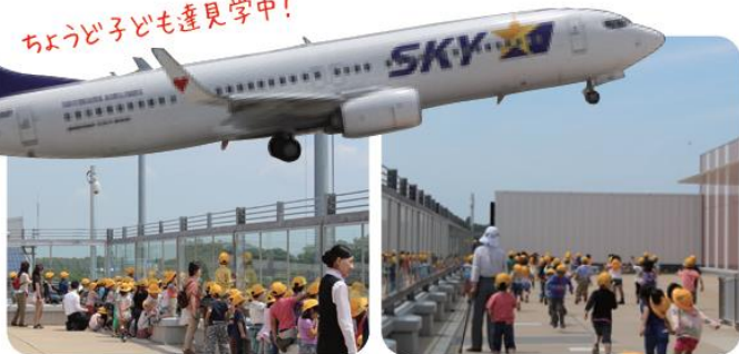
やっぱりまじかで見える飛行機にみんな興奮 Σ(≧□≦)ノ