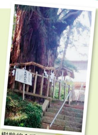
小高区 JR常磐線桃内駅