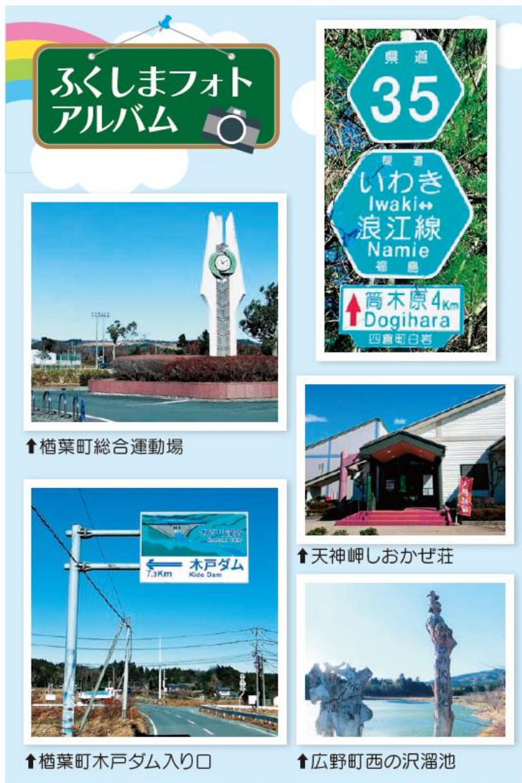
↑ 楯葉町総合運動場