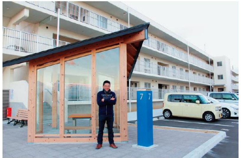
復興公営住宅にて

いです。近くに商業施設もありとても便利な所です。現在は3年前に戻っていた長男と一緒に暮らしておりますが、家族離れ離れで生活しているので寂しいです。何時か又4人皆で一緒に暮らせる事を願うと共にそれを実現できた時が復興の第一歩だと思っております。