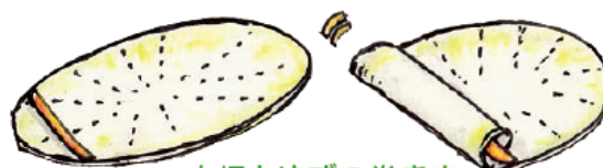
大根とゆずの巻き方