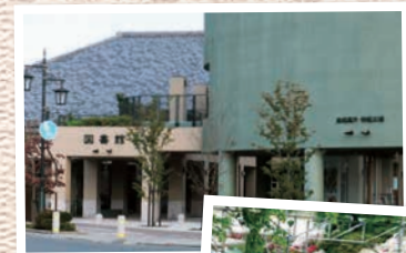
↑南相馬市 原町区図書館