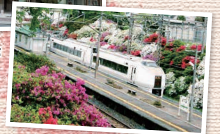
↑富岡町 夜ノ森駅構内