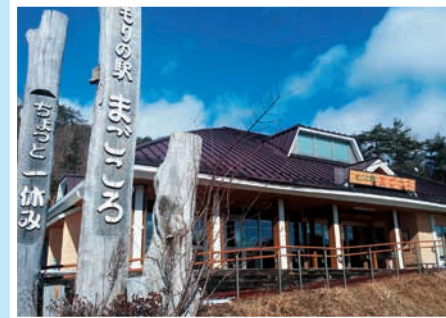
←飯館村 「もりの駅まごころ」