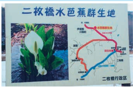
→飯館村 水芭蕉群生地入口