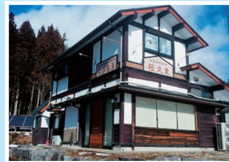
←飯館村 自家焙煎珈琲「極久里(あぐり)」