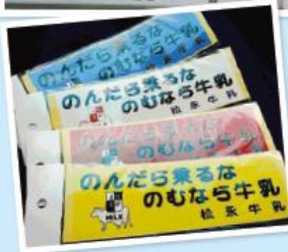
↑原町の松永牛乳株式会社が販売しているシール