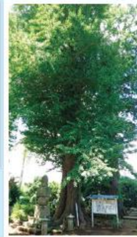
←小高区指定文化財のいちょうの木