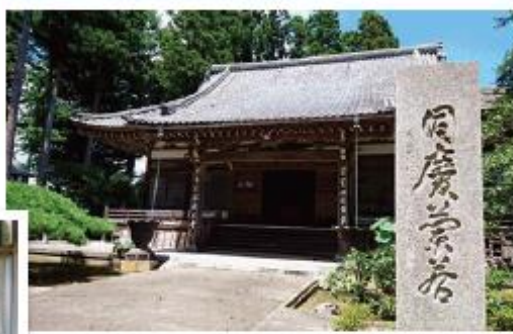
↑いちょうの木がある同慶寺