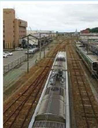
↑原ノ町駅陸橋の上から