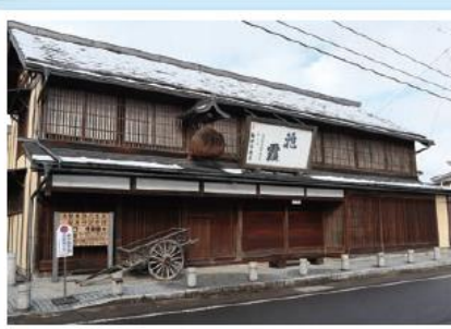
↑ 高村智恵子の生家

→ 高村智恵子 二本松市油井の長沼今朝吉(酒造業)の長女。洋画家・紙絵作家。夫の高村光太郎の詩集『智恵子抄』で知られる。