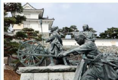
↑ 二本松少年隊群像