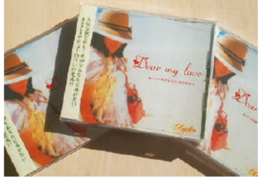
2017年8月発売 Dear my love

CDの売上の一部を北海道胆振東部地震の被災地に寄付したいと思います。定価1000円。